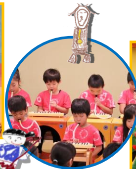
5歳児：メロディオンと「美女と野獣」