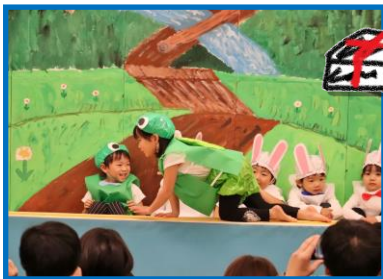
3歳児：「うさぎとかめの運動会」

3歳児から5歳児までの子ども達が、クラスごとに歌や劇、オペレッタ等を披露してくれました。かわいい衣装を身にまとい、元気にセリフを言ったり歌に合わせて踊ったりする姿は見ている大人たちをとっても和ませてくれましたし、堂々と振舞う姿は大きな感動を与えてくれるものでした。