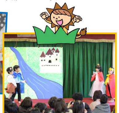
5歳児「長ぐつを履いたねこ」