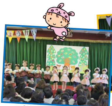
2歳児「森のくまさん」

2歳児から5歳児まで、クラスごとにかわいい歌や劇、オペレッタを披露してくれました。舞台の上で泣いてしまう子や固まってしまう子もいましたが、それがまた、かわいらしさを演出してくれました。どのクラスも子どもなりに緊張している様子や真剣さが伝わってくる素晴らしい演技でした。